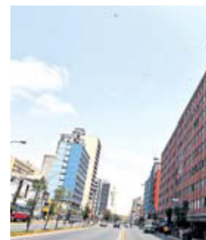
Modificación. Edificio de Popular y Porvenir está en av. Tacna.

Por otro lado, en Los Olivos, la empresa Mega Polvos S.A. prevé el desarrollo de un centro comercial (Megapolos) en la av. Alfredo Menéndez. También la Corpora-