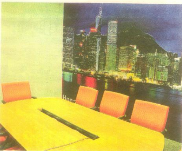
FUSIÓN CON LA MODERNIDAD. La rehabilitación del edificio guarda en su interior un diseño bastante contemporáneo.

cambio es el que sorprende, pero no de manera negativa. Los acentos modernos con los que se han adecuado las plantas del edificio Fénix brindan las necesidades de confort y de organización que toda empresa requiere. Un mobiliario que no busca cerrar áreas sino que, de lo contrario, opta por una mayor amplitud visual es lo que se luce, aportando también a la horizontalidad laboral. Finalmente, las salas de reuniones poseen gigantografías que le dan color y dinamismo a los ambientes.